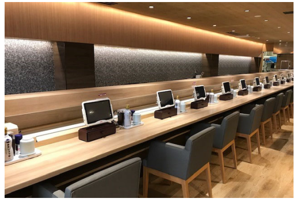
一番奥に、カウンター席をご用意

内装は落ち着いた雰囲気にしつつも、匠の技が光る厳選寿司を、気軽に楽しんでいただけるよう、寿司は1皿100円+税からご用意しております。