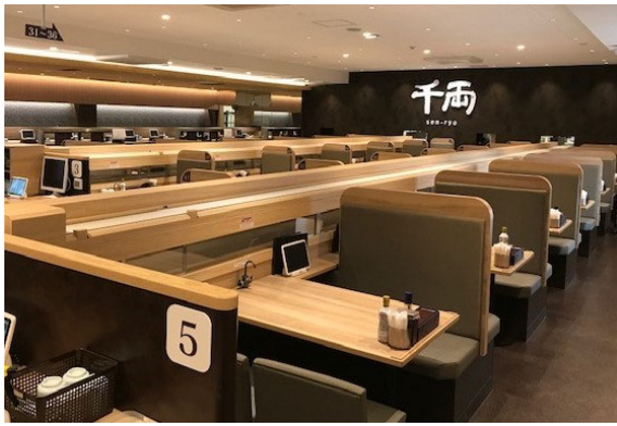
気軽に楽しくお食事できるテーブル席