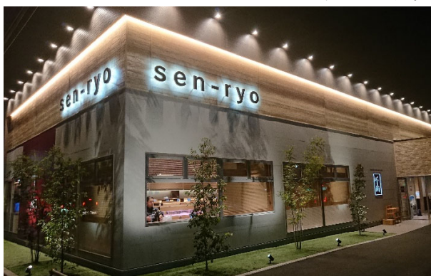
店舗イメージを一新

千両小山店は、2001年7月1日に元気寿司グループのトップブランドとしてオープンいたしました。この度、大規模な改装を経てリニューアルオープンいたします。