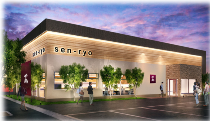
※ 店舗イメージパース

寿司レストランチェーンを展開する 元気寿司株式会社（本社：栃木県宇都宮市大通り 代表取締役社長 法師人 尚史）は、12月12日（木）に、千両小山店（栃木県小山市）をリニューアルオープンいたします。